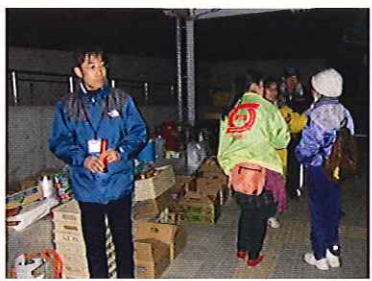
東日本大震災の発災時、避難所では普段から学校に携わる地域の人が大活躍だった。写真内の黄色いジャンパーの人は、普段登下校の安全指導をしているボランティア。「校長先生、何手伝えたいのっさ」と積極的に声をかけてくれた。

仙台でも震災前から学校と地域の連携に積極的だった場所は、防災目的でなく地域全体で子どもを育てるという意識でやっていた。万が一のときでなく、日々の活動の中に成果があることで、さらに両者の連携が深まるんです。